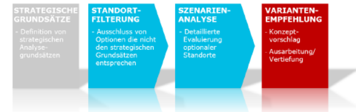
Abbildung: Erarbeitungsprozess der Machbarkeitsstudie